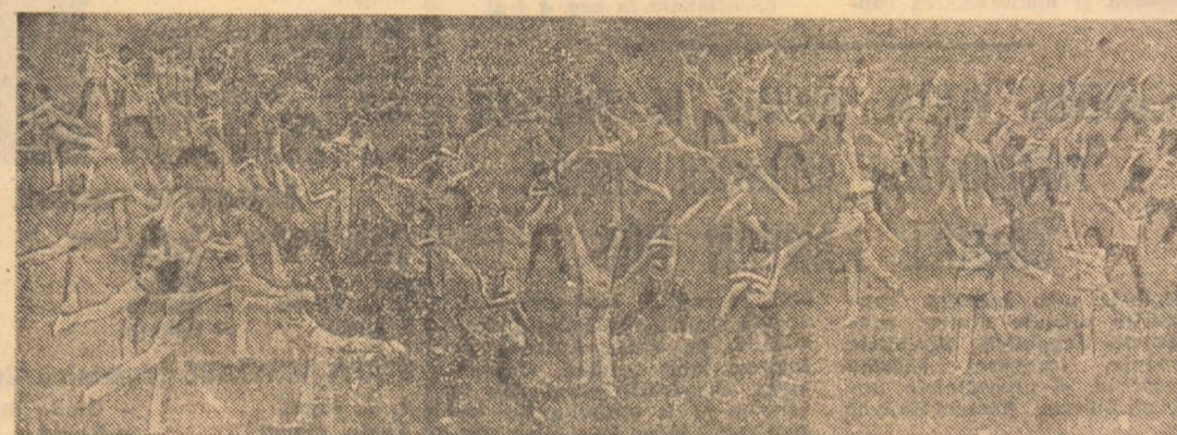
Unul dintre cele mai frumoase momente ale întrecerilor studentești de la Complexul Tei - reprima de gimnastică a I.E.F.S.

Fără să eforturi, Di acest derby rie limpede tață - dup valorică în nenților cel firească - care echipe nirea: gazi start, decia au aglomese de teron, i ceva” din stingă ale șuturile de Mocanu. În re, „cartea sîmbătă, ci ales că Di din nou, de mare vervă naționale c 38 de min teren - n Păcat (pen! accidentarea tindere mu: rea - spi nepăcute - din joc. Dinamo a multă hotărârea ferm care Butufe le eforturi) evitat: el MOVILA și de metri, i rul unui ar în plasa U Iliac salv la un脾 Cămătaru. Videa, da este major: precavă la t-avă pe și CĂMĂT 2-0. După p schimbă as Chiar di se anunță dă. Astfel, reia cu c pe stînga, plus de Șa punzînd cu executată: gea loveste bă direcția, tă, dar Șt cele din un domină, dă sterilă, d strict și ș a închide puțin de șa ben-negrilo cajul” pite păcătuiesc cu exagera inapoi (un altele - în Bălan ca) mului urmat pase rit, V. Șt Fazele mal prizei: mir Barbu, dup Maradona” de margine careului ma tare rarish fel de „arr venilor, el finalizare, c min. 40 - din nou și min. 42 și c ente în faț cu Barbu, în prim-p Stancu (re piciorul din la un sut s F.C.M. do a doua, rep schimb. rep