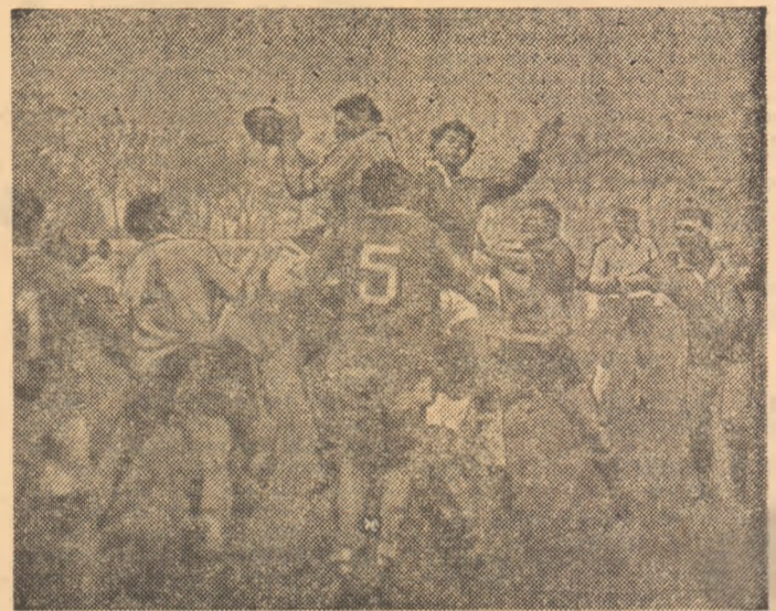
Caragea s-a înălțat și a cîștigat clar disputa în margine.

Repriza a doua a debutat, practic, cu prima încercare de pătrundere a ibericilor către butul românilor, Queimado beneficiînd de lovitură de pedeapsă: 27-3 în min. 41. Jocul s-a mutat imediat în cealaltă jumătate, Popescu „semnînd“ eseurile din min. 50 - cursă de 40 m, după ce balonul a trecut prin multe miîni - și 54 - la o reușită schematică, cu intrarea lui pe aripa opusă. Fază lungă de atac și peste alte patru minute, încheiată de Tofan în but, apoi (min. 66) o plecare inspirată a lui L. Constantin după grămadă și ultimul nostru eseu, reușit de... Popescu. Conturile erau încheiate, „tricolorii“ au slăbit ritmul, încercîndu-se u-