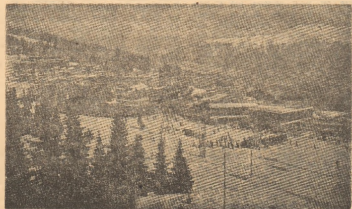
Imagine de ansamblu a viitoarei gazde a Jocurilor Olimpice de iarnă 1992