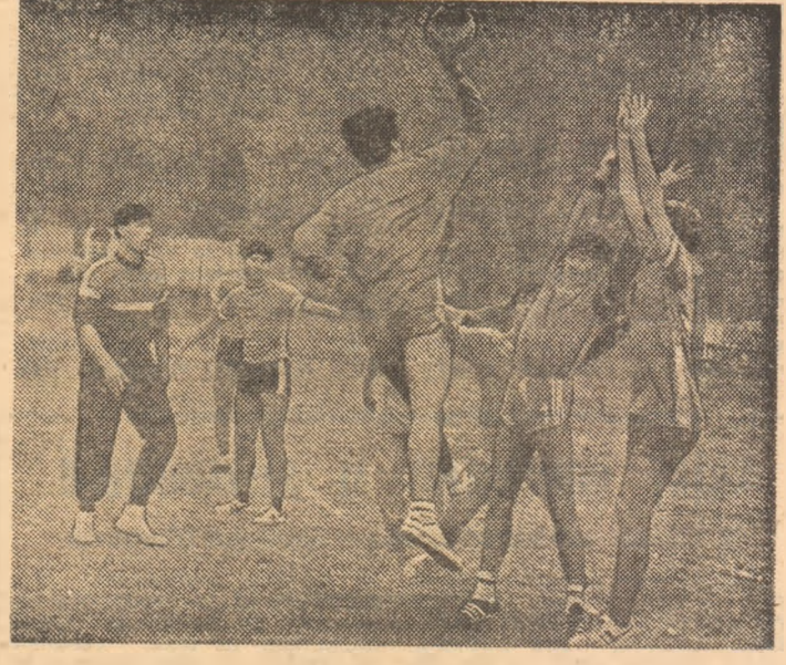
Fază rapidă la semicerc, în întâlnirea dintre echipele de băieți ale liceelor nr. 3 și nr. 8

perspectivă. Și, ca în toate celelalte „toamne ale bobocilor handbaliști”, atmosfera de întrecere pasionantă a cuprins întreaga bază sportivă, iar zarva galeriilor i-a dat și mai multă culoare și aplomb. Un vast tablou policrom, în continuă schimbare, competitorii intrând succesiv în scenă și retrăgându-se în rindul galeriilor. Nu ștai lângă care dreptunghi să zăbovești mai mult, la cel pe care se întreceau, în meciul socotit până la urmă drept cel mai frumos, între e-