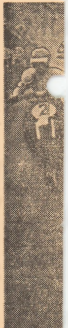
Piloții la c

Trecînd ne-am gîndit că Șiraua Capitală, bombrie, ca trece cîndu-și a ne extrem bene, alcarbene, Ză... liniștii, verde”, cu spune, pl de la pod de a nu pomii de a „cetatea g din locuri copli stau tr-un film terenurile mică — doar plas metalice baschet. — Gata 1 mitru Oie hd strand pînă. Si prind viața ștra zon. Intr-anzimțit: organizat sportive Dacla, de venit de 10 000 de