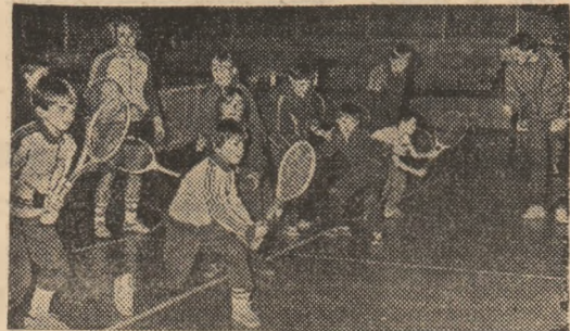
Inițierea în tenis se extinde necontenit în multe unități de pionieri din Capitală și de pe cuprinsul țării

chis tu intitulat construiti Sportiv na, bo au atite concrete sa le p tele int ca un popular din plin bului no purtat c șeneanu material bile in practic de... fan tia copii mite), localități multe a fabricii. boburi . . . totuși. Daniel constituit ingenia sigur. S extins. I ceu ind grup sco lucrările mă ar execuția cepile p litatea menea: did concurs nizat ch Sinafia, o miile d creație (a se cl cele loc Iată to care le l ția de s mul rî sportive tatea ci iarnă și Minister vătămînt răspunsu zăpadă : nu-l așe rîndu-ne mai u obiect — tenilor s