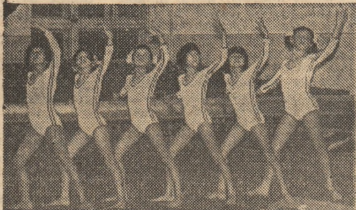
Dorința de a se dedica sportului grației este comună multor cu tricolor...