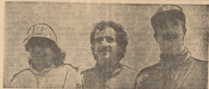
Podiumul Campionatului Mondial al Formulei 1, în 1986: Piquet, Prost, Mansell (de la stînga la dreapta).

Super-cupa continentală a fost câștigată de C.F. Barcelona, care a întrecut pe Cibona Zagreb cu 99-87. În tur, rezultatul fusese favorabil formației iugoslave cu 102-101.