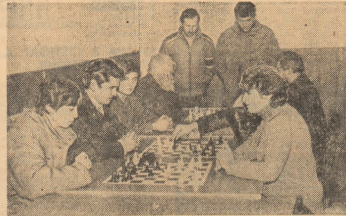
Și la Vaslui șahul este un sport al tuturor vîrstelor