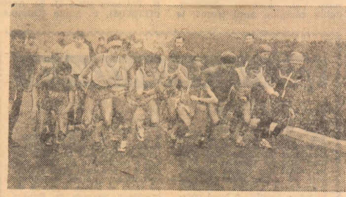
Tinerii vasluieni participă cu entuziasm la întrecerile de cros