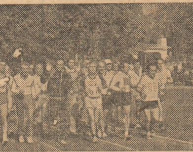
o alergare plăcută, cu participări entuziaste acordă un prețios premiu de sănătate.