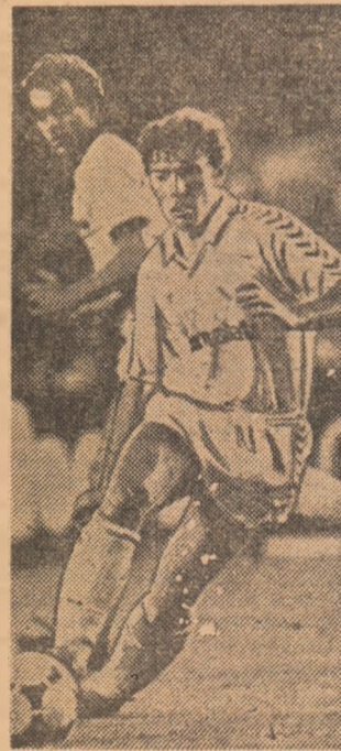
Butragueno (Real) în atac și în umbra lui (la propriu și la figurat), Platini (Juventus).

gen, Beveren, Glasgow Rangers, Bayer Uerdingen, Internazionale, Guimarães, Mönchengladbach, La Gantoise Torino, Dukla Praga, Barcelona, Hajduk Split, F.C. Tirol, I.F.K. Göteborg, Spartak Moscova și Dundee United.