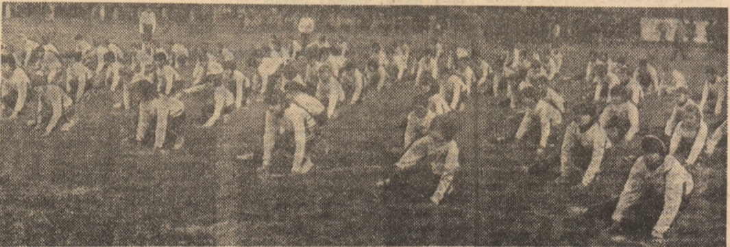
Secvență din repriza de gimnastică a Sectorului 2

În Capitală, pe Stadionul Tineretului, mil de participanți au marcat, prin reușite demonstrații și întreceri, acest moment sărbătoresc