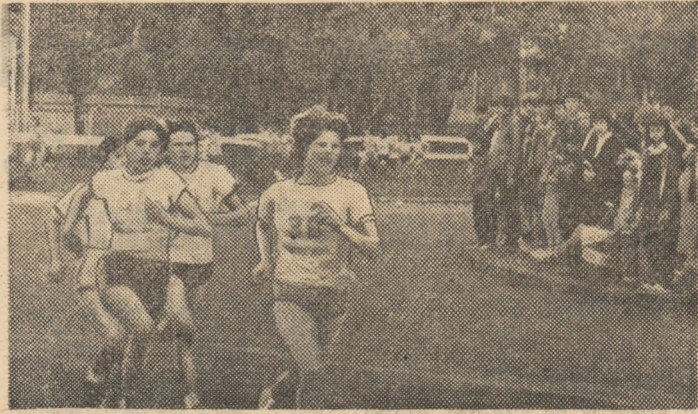
Intrecerile de cros rămân pe primul loc în topul Daciadei

care pionier de la această școală alunecând la fel de bine atât pe patine, cât și pe schiuri.