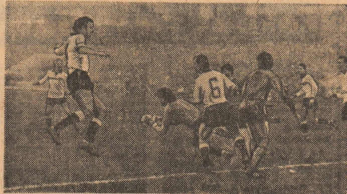
Superioritate numerică clujeană (tricouri albe) în fața buturilor steleiste, unde portarul Stingaciu intervine prompt.