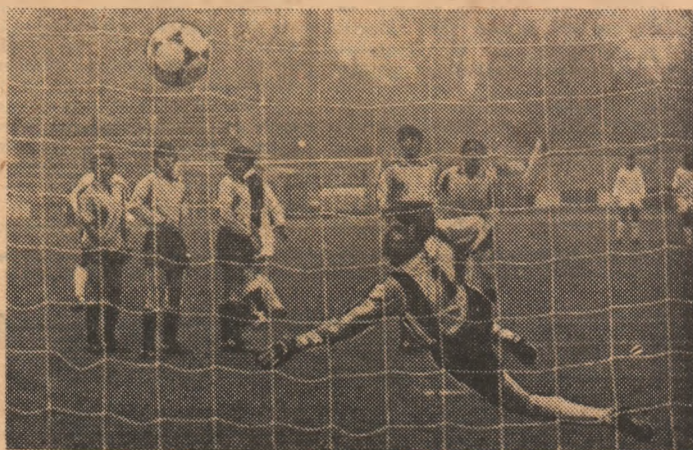
Orac a șutat imparabil și... Dinamo — Oțelul 2-0

(Citiți cronica acestui meci în pag. 2-3)