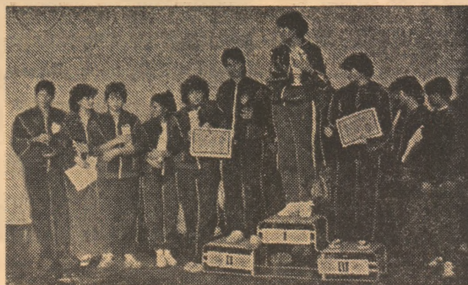
Pe podiumul de premiere, echipele din Cluj-Napoca (locul I), București (II) și Suceava (III).

bagajul de cunoștințe în domeniul educației fizice al educatoarelor și învățătoarelor, în perspectiva cuprinderii, a participării TUTUROR copiilor și elevilor la activități de mișcare, la exerciții fizice, în mod sistematic, organizat, la competiții sportive. S-a mai făcut, însă, un pas. Sub mobilizatoarea emblemă a