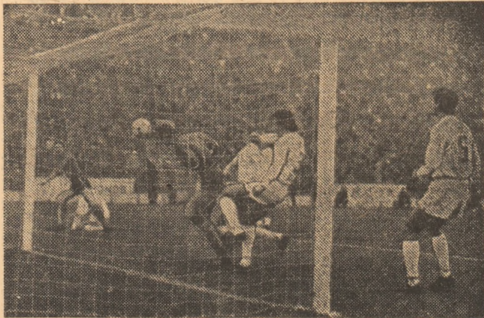
Momentul deschiderii scorului în partida disputată ieri pe stadionul Steaua.

Fortînd încă din start în atac, Steaua a luat repede conducerea pe tabela de marcaj, în min. 5, cînd, în urma unui corner bine executat de Lăcătuș, de pe partea stîngă, mingea a fost trimisă în poarta lui Moraru printr-o excelentă lovitură de cap a lui BUM-BESCU (îl socotim pe el ca autor al golului chiar dacă, cu foarte puțin înainte de a depăși linia porții, mingea a mai