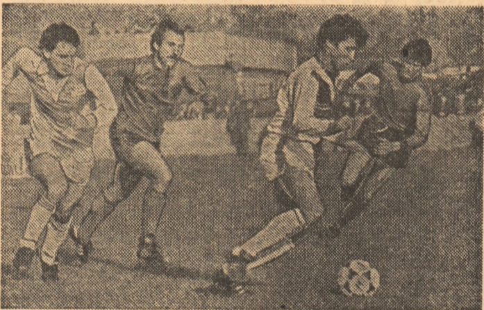
Meciul Victoria — Steaua deține „capul de afiș” al etapei. Iată o secvență din meciul celor două echipe disputat în turul campionatului trecut

Sîmbătă, în prima zi, sînt programate două reuniuni, iar duminică semifinalele și finalele precum și festivitatea de premiere a cîștigătorilor.