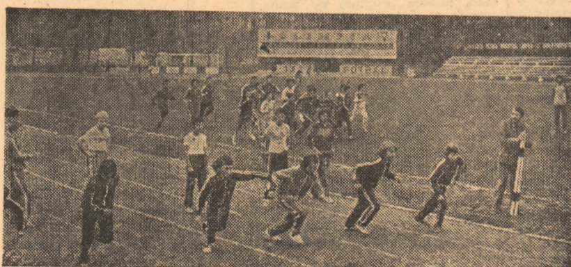
Stadionul Olimpia din Slobozia este leagănul atletismului ialomitean. El s-a impus în ultima vreme prin școala sa de alergări, juniorii antrenati de Ion Neacșu, Andrei Ionescu și Dumitru Iacob impunîndu-se tot mai mult în întrecerile rezervate vîrstei lor. De altfel, pista stadionului este un „stup” unde se lucrează non-stop, dovadă și imaginea surprinsă, deunăzi, de fotoreporterul nostru Aurel D. NEAGU.

Etapele duble de azi și de miine programează, în prima serie valorică, partidele Progresul — Steaua, Rapid — Dinamo (în cuplaj), la Bazinul Floreasca din Capitală — sîmbătă de la ora 10 și Crișul Oradea — Voința Cluj-Napoca. În seria a II-a: Constructorul Tirgu Mureș — CSU-TMUCB, Progresul Oradea — Vagonul Arad și CSȘ Triumf — I. L. Timișoara (Bazinul Floreasca, orele 13, respectiv 9).