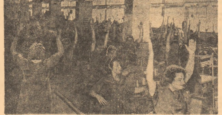
Pe cale de generalizare, gimnastica la locul de muncă reprezintă o activitate practică cu toată convingerea de către mii de angajați ale întreprinderii de confecții din Birlad

cu o tribună de 3000 de locuri, iar sub tribuna centrală, vestiare, bloc social, spații pentru atletică grea etc. ● Generalizarea gimnasticii la locul de muncă — iată una