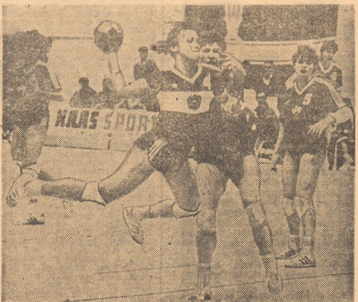
Deși cotate printre favoritele C.M., handbalistele din R.D.G. (aici în apărare) au avut mult de furcă în meciul cu Austria, obținînd o victorie mai strînsă decît se preconiza: 25-20.