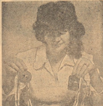
Cu trofeele cucerite în disputa elitelor șahiste mondiale...