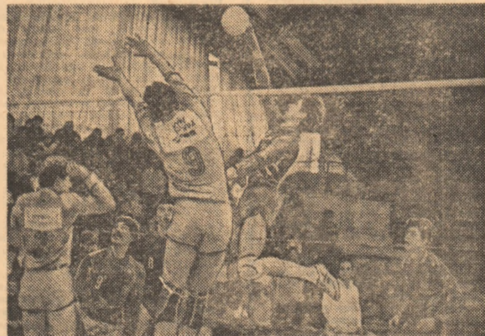
Stelistul Dascălu alertează mereu apărarea adversă. Iată-l, în atac, într-un precedent meci din cupele europene

și ea o misiune ușoară, danezii nereușind la București decît 9 puncte în trei seturi! Și în acest caz, calificare sigură. (A.B.)