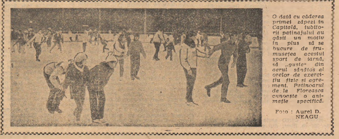
O dată cu căderea primei zăpezi în Capitală, tubitorii patinajului au găsit un motiv în plus să se bucure de frumusețea acestui sport de iarnă, să „guste” din aerul sădătos al orelor de exercițiu fizic și agrement. Patinoarul de la Floreasca cunoaște o animație specifică.

performanță. Dorim să intensificăm concursurile stradale din Sinaia (strada Aosta, așa cum se sugera și în ziarul dv. Sorin SATMARI (Continuare în pag. 2-3)