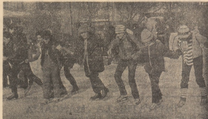
Îndrăgii tot mai mult de către tineretul școlar, patinajul s-a înscris ca una din preferințele multor copii și elevi în vacanța albă care începe astăzi...