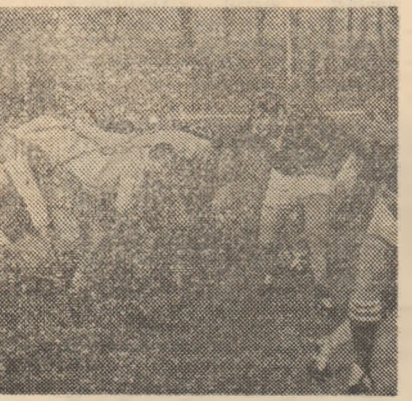
au marcat cei 70 de ani de existență s-a înscris și un meci demonstrativ, tori ai echipei, reprezentanți ai mai ri...