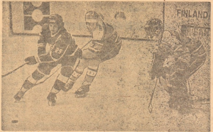
Aspect din meciul echipelor U.R.S.S. și Suediei, din cadrul „Cupei Izvestia“, la Moscova.

COGNE. În Italia s-a desfășurat o cursă feminină pe 20 km (stil liber) în cadrul „Cupei Mondiale“. Pe primele