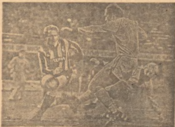
În stînga, K. H. Rummenigge (Inter) în acțiune, ca în zilele sale de glorie...

ca nic un gol. Maradona a avut o prestație deosebită în jocul cu Como (2-1) fiind coautor al ambelor puncte înscrise de formația napolitană. ● Boniek (Roma) a fost principalul vinovăt al înfrîngerii pe teren propriu (1-2 cu Milan). La West Ham, pe ter-