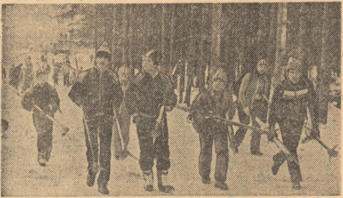
În mers pe o stradă din Bușteni foarte solicitată în această perioadă intrucit duce la stația... de unde telecabinele poartă pe iubitorii de schi spre virfurile pline de zăpadă ale Bucegilor. În imaginea noastră, un grup de tineri bucareșteni plecați de dimineață spre culmile albe.

lui ridicat pe care îl detine școala românească de gimnastică și sunt un puternic stimulent pentru a pregăti și mai bine importanțele examenele competiționale ale acestui an. Mă gîndesc, în primul rând, la Campionatele Mondiale din Olanda și la Campionatele Europene de la Moscova, întreceri de o deosebită importanță în acest an preolimpic.