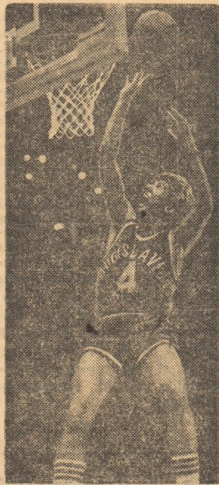
În acțiune Drazen Petrovici, maestrul aruncărilor la cos.

La 1,98 m, Drazen Petrovici a demonstrat că în jocul de baschet nu înălțimea este totul, că antrenamentul perseverent, talentul, dorința de a fi tot mai bun, pot compensa handicapul de talie față de gigantul danourilor. La 22 de