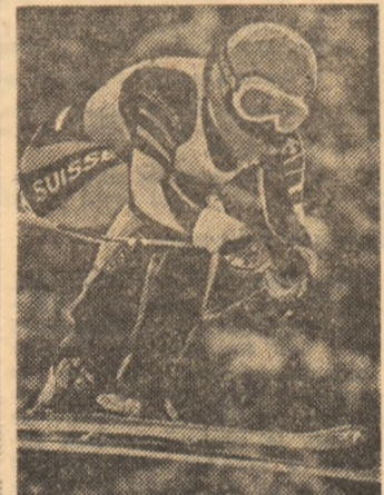
Elvețianca Maria Walliser, una dintre cele mai bune schioare ale lumii