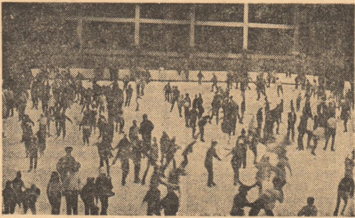
Patinoarul din Suceava, la „ora de sport” pentru cei de toate vîrstele.