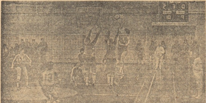
Elena Negulescu trage din nou pe lângă blocajul advers (Fază din meciul Calculatorul I.I.R.U.C. - Flacăra Roșie)