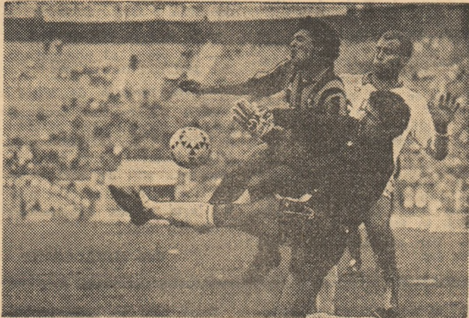
Mereu percutant, forșind porțile adverse, Altobelli (Inter) conduce în clasamentul golgeterilor campionatului italian, cu 9 goluri. Iată-l în imagine (tricou vărgat), la un pas de un nou gol.