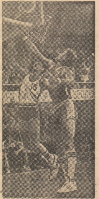
În acțiune Arvidas Sabonis, principalul arizan al victoriilor echipei Jalgiris Kaunas, una dintre candidatele la câștigarea C.C.E. Fază din meciul cu Steaua, disputat în toamnă la București.

Rezultate înregistrate în grupele sferturilor de finală ale cupelor europene la baschet - MASCULIN, CUPA „RADIVOJ KORACI“, grupa A: Arexons Cantu - C.S.P. Limoges 97-88 (48-39), Sibenka Sibenik - Spartak Leningrad 91-99 (40-45); grupa B: Split - Olympiques Antibes 93-91 (46-46), Varese - F.C. Barcelona 82-79 (43-51); grupa C: Berloni Torino - Partizan Belgrad 91-90 (51-46), Assubel Andenne (Belgia) - C.A.I. Zaragoza 88-79 (44-40); grupa D: Challans (Belgia) - Buducnost Titograd 114-97 (48-50), Juventud Caserta - Caja Postal Madrid 111-109 (56-50). În semifinale se vor disputa meciurile (tur-retur, la 18 și 25 februarie) C.A.I. Zaragoza - C.S.P. Limoges și Juventud Caserta - F.C. Barcelona.