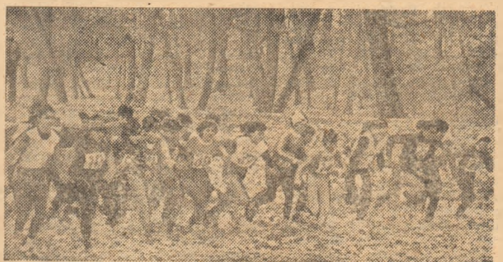
Crosul, întrecere de sezon, pentru toate vîrstele, pentru mișcare în aer liber, pentru sănătate.