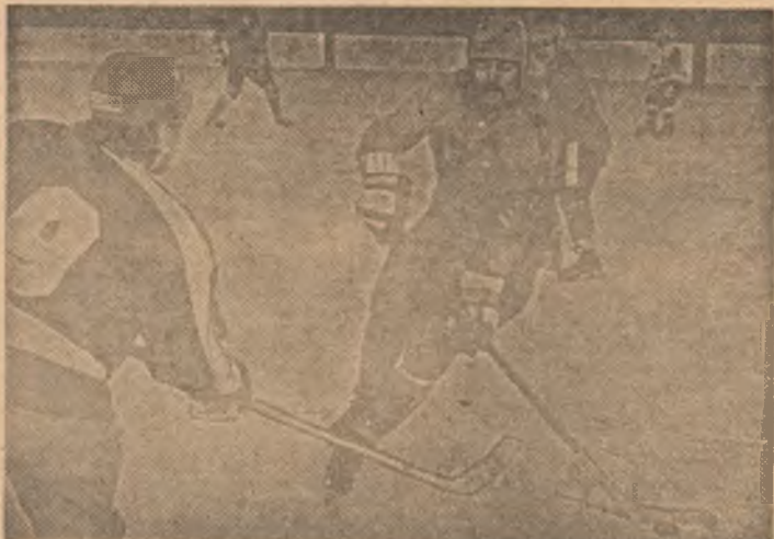
Steaua și-a asigurat de pe acum locul 1 în campionatul 1986-87. Iată în imaginea noastră pe Chiriță, unul dintre cei mai valoroși jucători ai campioanelor, în plină acțiune.