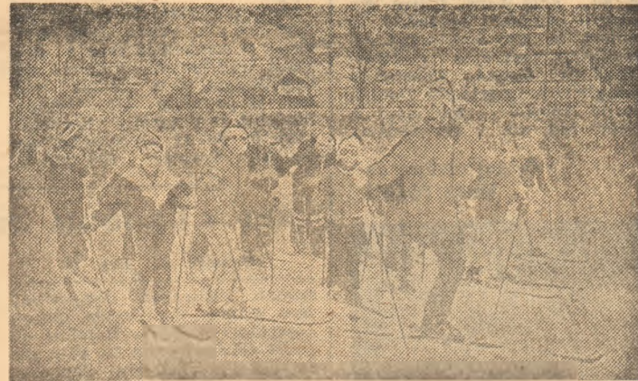
A nins din belșug în toată țara, eveniment meteorologic primit cu mare bucurie, îndeosebi de copii, care au pornit să... alunece, cum s-ar spune, pe orice. Cel din imaginea fotoreporterului nostru Aurel D. NEAGU au ales, după cum se vede, schiturile, deoarece orașul lor, Sf. Gheorghe, are dealuri destule în împrejurimi.