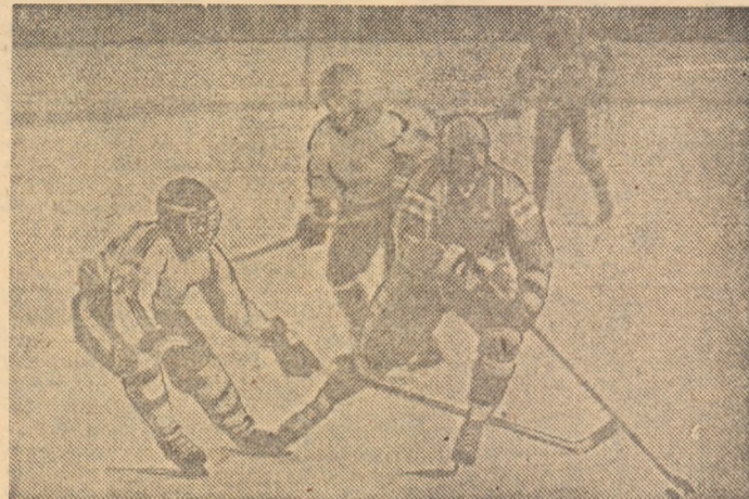
Fază de atac la poarta echipei Bulgariei