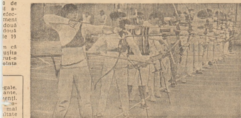
Gata de tragere la 2 x 25 m

pta- fost, tă și Da- telor ceas- o de d a- efec- ment două două le 19 din Rădăuți și Satu Mare care și-au împărțit toate titlurile. Dintre rezultatele înregistrate în cele două reuniuni merită a fi evidențiat cel realizat de Ga-