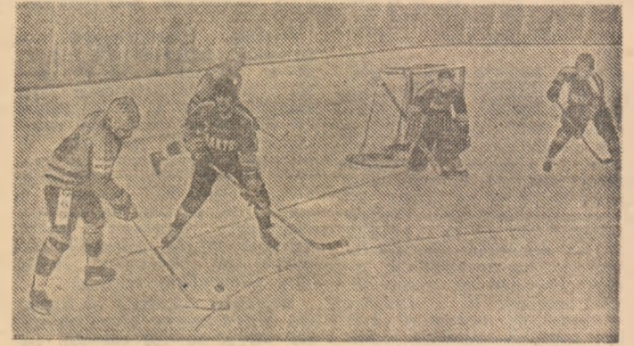
Hocheiștii noștri în apropierea porții echipei sovietice

• Trofeul a revenit Selecționatelor de tineret (20 de ani) a Cehoslovaciei