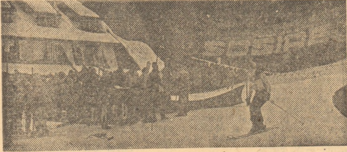
O nouă cursă, un nou învingător