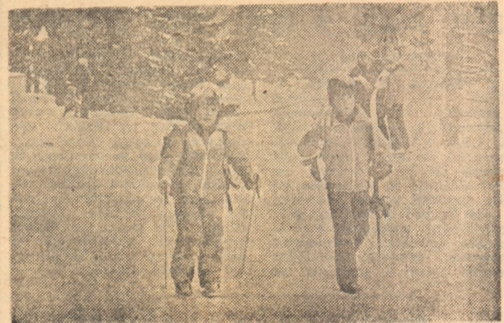
Cu rucsacul în spate și cu schiurile sub braț - așa se fac primii pași spre îndrăgirea sporturilor de iarnă.

Dacă comportarea echipei naționale a constituit și constituie preocuparea majoră a opiniei publice sportive, destigur că și activitatea internă a stat în atenția iubitorilor sportului cu balonul oval. Cel de-al 70-lea campionat, care a început în toamna trecută - în formula: două serii a câte zece echipe - prilejuiește cîteva considerații interesante. Astfel, am putea spune că am asistat la o întrecere de valoare doar medie, destul de puțin fiind partidele care să rămîna în memorie, dintre acestea cu virtuți tehnice și spectaculare deosebite. Meciurile dintre „mai marii” rugbyului nostru au oferit, ce e drept, dispute dirze, nu însă și de o calitate superioară. A slăbit vizibil jocul înaintărilor, iar liniile de treisferturi au etalat un repertoriu adesea prea sărac. O altă constatare (de data asta de ordin pozitiv): „troului”, oarecum clasic al campionatului - Steaua, Dinamo, Farul - i s-au alăturat în ultimul timp Știința Cemin Baia Mare, în evidentă creștere în vremea din urmă, CSM Sibiu, de asemenea o surpriză plăcută, RC Grivița Roșie, care, iată, revine, după mulți ani, încet dar sigur, spre virful pi-