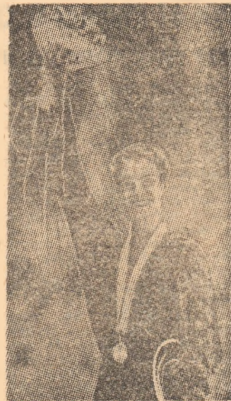
Katarina Witt (R.D. Germană) a câștigat pentru a cincea oară titlul de campioană continentală la patinaj artistic

FENIS DE MASĂ. În localitatea olandeză Hulzen s-a desfășurat meciul dintre echipele Olandei și Bulgariei, continuu pentru „Cupa ligii europene”. Gazdele au obținut victoria cu scorul de 6-1.