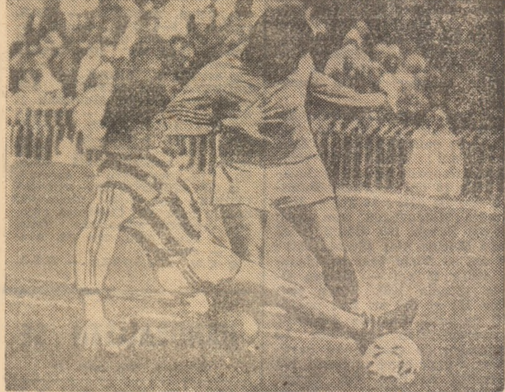
F.C. Napoli este lideră a campionatului italian, o contribuție importantă avînd-o faimosul Diego Maradona, pe care-l vedeți în imagine într-un meci cu Ascoli