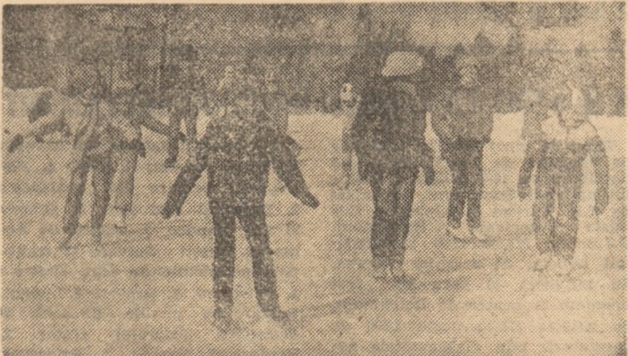
La patinoarul natural al asociației sportive „Locomotiva“

la fata locului să vedem cum se poate realiza acest lucru pe un teren pe care, în afara sezonului de iarnă, se joacă tenis. Și se poate deoarece baza