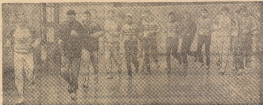
Handbaliștii lotului reprezentativ la unul dintre ultimele antrenamente înainte plecării la Campionatul Mondial, grupa B, din Italia.

delungată a unuia dintre cei mai buni portari de handbal, gimnastica a jucat un rol deosebit de important. Și cînd în sfîrșit se „scapă“ de elongații, rotări, extensii, apare și mingea, neînsita și dorita minge, în mil-