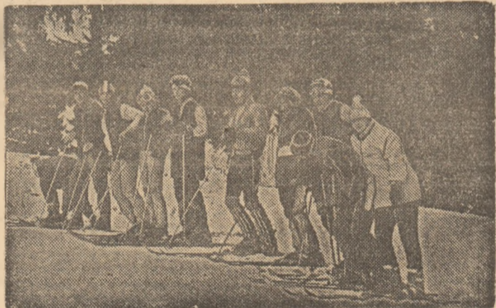
La Vatra Dornei, înaintea primelor starturi...