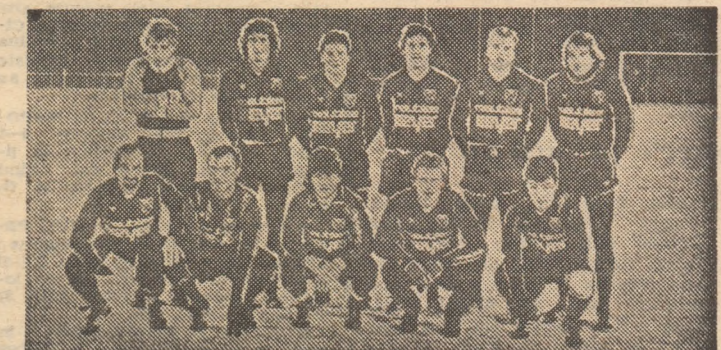
Echipa Neuchâtel Xamax, prima după terminarea turului. Va reuși să câștige campionatul?