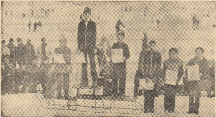
Copiii din zona Dornei, iubitori ai săniișului, trîtesc din plin bucuriile iernii. O imagine de pe piriite comunei Dorna Căndreni, la o festivitate de primizre...