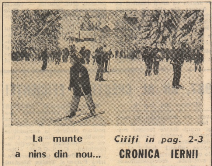
La munte Cîrîți în pag. 2-3 a nins din nou... CRONICA IERNII