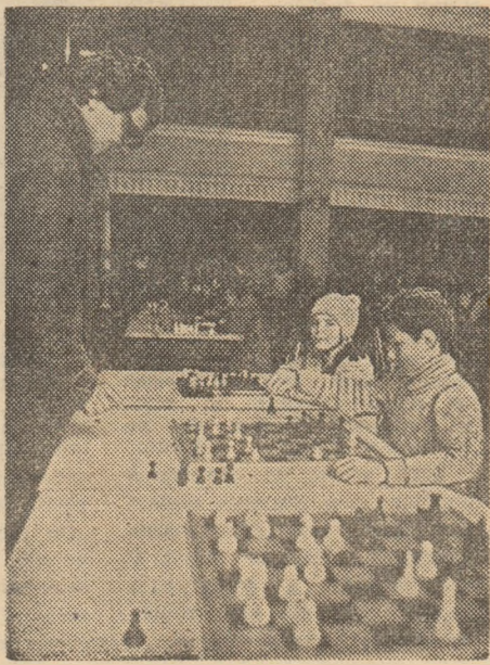
Șahul, un sport al tuturor, din ce în ce mai îndrăgit și de copii.