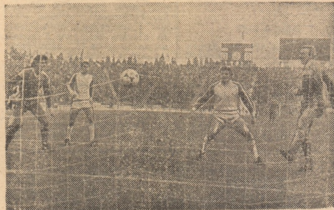
Bumbescu (primul din dreapta imaginii) înscrie unicul gol al partidei Steaua - F. C. Argeș, care a adus echipei bucurestene o victorie meritată.