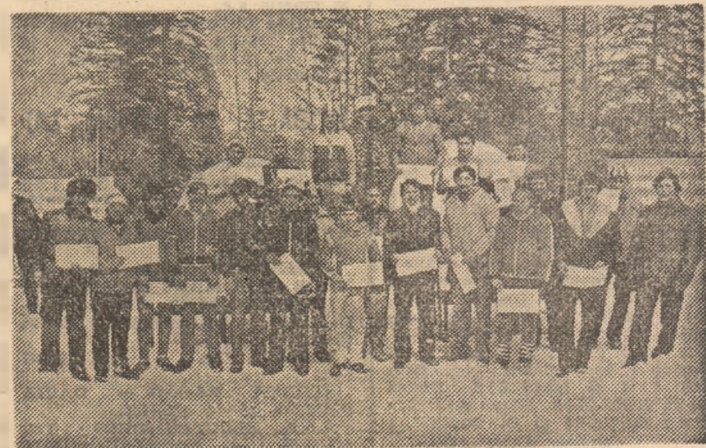
Laureații primului concurs...