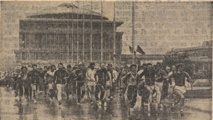
În pofida frigului și a ploii (cu lapoviță), studenții bucureșteni au asigurat reușita concursului de cros organizat duminică pe platforma de la Politehnică