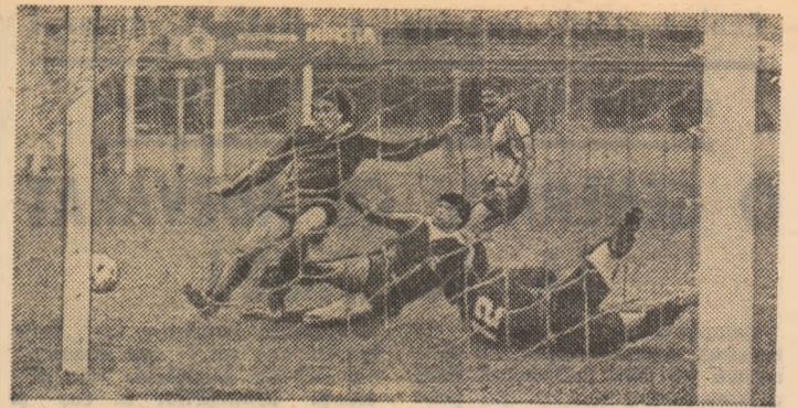
Rapidistii Tiră și Tirban (căzut la pămînt) se împiedică reciproc în fața porții lui Liliac și nu pot fructifica o reală ocazie de gol. (Fază din meciul Rapid-Petrolul, scor 2-1).