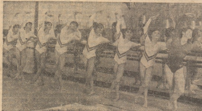
Exerciții de pregătire artistică, în finalul antrenamentului, cu accent pe îmbunătățirea ținutei

În agenda ei se află „fotografiată” întreaga activitate zilnică a tuturor gimnastelor. Într-un cod numai de ea știut, sînt notate, cu rigurozitate, execuțiile bune, nereușite, nivelul la care a fost prezentat un ele-