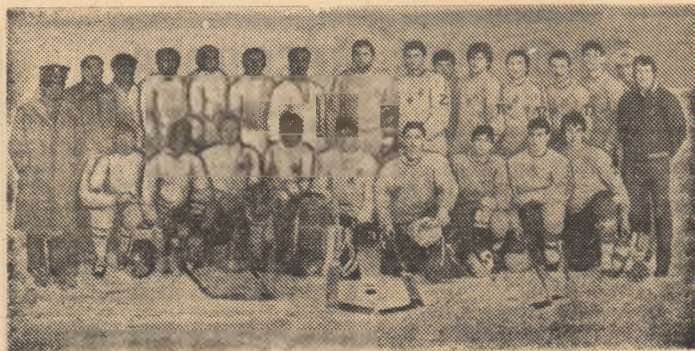
Echipa de hochei Steaua București, din nou campioană.