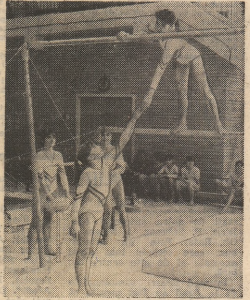
Antrenamente intense înaintea „internaționalelor”...

La cea de-a 30-a ediție și-au anunțat prezența gimnastele și gimnaștii din 20 de țări, cărora li se vor alătura, firesc, și puternice reprezentative ale țării noastre. Au răspuns invitației adresate de forul nostru de specialitate federațiile de gimnastică din Bulgaria, Bel-