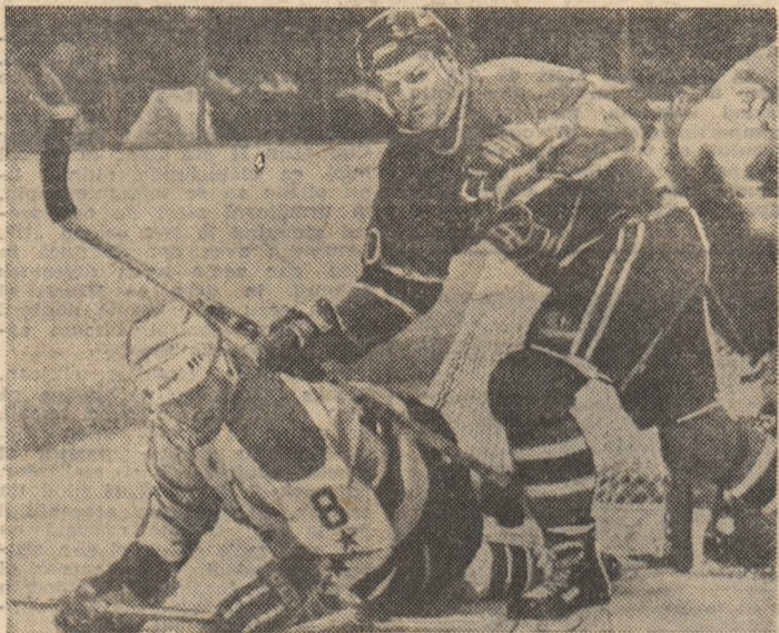
Aspect dintr-un meci de hochei din campionatul americano-canadian (NHL). In echipament închis, Montreal Canadiens care în ultimul meci susținut a dispus de Boston Bruins, cu 4-2

● Bayern, în 10 jucători din minutul 30, rezistă Realului ● Dinamo Kiev pierde acasă, ca și în tur: 1-2 cu Porto. ● Deși învingătoare la Leipzig, Bordeaux ratează calificarea la 11 metri! ● Dundee realizează la Mönchengladbach (2-0) golurile pe care nu le-a reușit pe teren propriu!