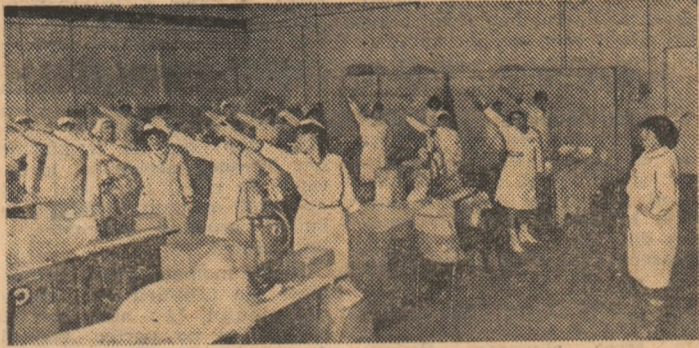
Gimnastica la locul de muncă — o „repriză de sănătate” la întreprinderea de Medicamente

Unirea, întreprinderea de Medicamente. Un singur exemplu: la întreprinderea „23 August” numărul practicantilor a ajuns la 16 900 (!), aici existând 203