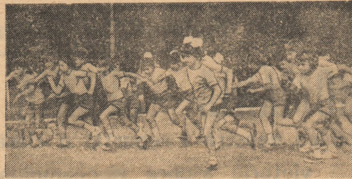
Primăvara este anotimpul crosurilor, îndrăgite — precum se vede — și de cei mai mici sportivi