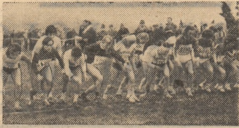
Start într-o nouă întrecere de cros a elevilor Liceului „Nicolae Bălcescu” din Craiova...