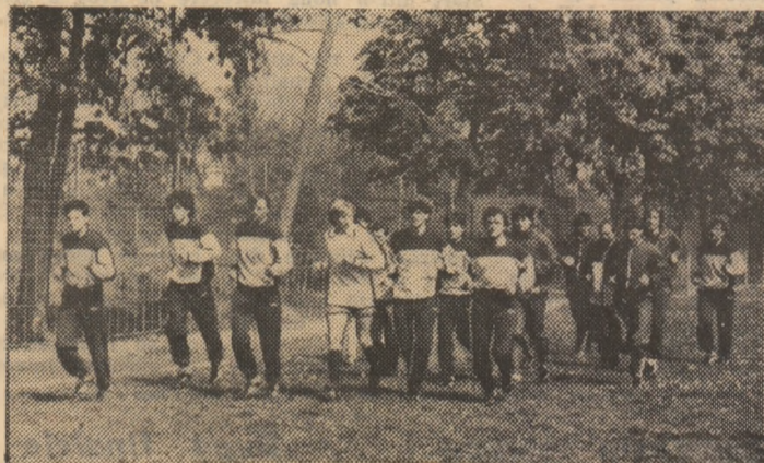
Aspect de la antrenamentul de ieri al lotului nostru olimpic Foto: I. LESPUĆ — Cluj-Napoca

Acum, firește, ne interesează în mod deosebit această intîlnire din orașul de pe Someș. Marți, cu ultimele antrenamente susținute, practic, preparativele celor două loturi s-au încheiat. Doar antrenorii mai zăbovesc asupra formulor de echipă cu care intenționează să înceapă jocul. De altfel, Z. Podedwary ne spunea că nu poate comunica „11”-le său decît miercuri la prînz. Cu ajutorul colegial al ziaristului Kazimierz Marcinek, de la „Przeglad Sportowy”, din Varșovia am intrat, totuși, în posesia unei formații probabile a Poloniei. Marți dimineață s-au alăturat lotului polonez atacantul Lesniak și portarul Wandzik, care au venit de la Budapesta, unde duminică au jucat în prima reprezentativă a țării împotriva