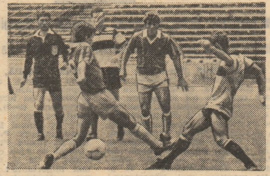
Stadionul „23 August” din Capitală a găzduit, duminică trecută, una dintre partidele interesante ale seriei a II-a a Diviziei B, Progresul Vulcan - A. S. Drobeta Tr. Severin. Iată o fază din acest meci, desfășurat pe coordonatele fair-play-ului, cum dorim să se întîmple, etapă de etapă, peste tot unde se joacă meciuri de fotbal.