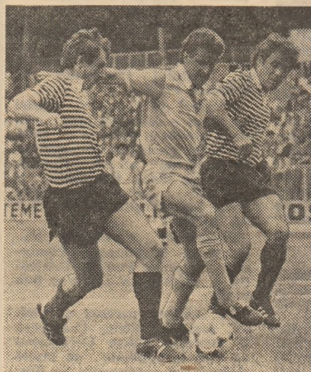
Surprinsă de fotoreporterul nostru Aurel Neagu, această fază pledează pentru frumusețea și sportivitatea (nici un cartonaș în 90 de minute) care au caracterizat, duminică, meciul dintre Victoria București și Universitatea Cluj-Napoca (tricouri cu dungă).

speranțe: V. Popa, Iovu, Albu, Persu, Tudorache, Gaiță. ● Cel mai frumos gol marcat duminică la Craiova? Acord unanım: cel al lui Ungureanu, dintr-un plonjon spectaculos.