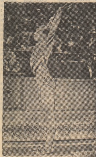
Daniela Silivas, la sol

S-a spus despre Daniela Silivas, noua campioană absolută a Europei, că intruchipează ceea ce poate avea mai frumos și mai complet o gimnastă a zilelor noastre: un extraordinar echilibru psihic, pregătire tehnică și fizică exemplară, o putere de concentrare rar întâlnită la alte sportive, o completă detașare de tot ceea ce se întâmplă în arenă în jurul ei. În mod firesc, toate aceste calități s-au reflectat și în evoluțiile pe care Daniela le-a avut săptămîna trecută în cadrul celei de a 16-a ediții a Campionatelor Europene de gimnastică feminină. N-a surprins pe nimeni, de pildă, că Daniela Silivas a debutat în concurs cu 9.95 la birnă. Este aparatul ei preferat, e proba în care și-a etalat și în numeroase alte rânduri calitățile ei excepționale, virtuozitatea și înalta măiestrie cu care execută elemente dintre cele mai grele, ușurîndu-se pe cei 10 centimetri al birnei prezintă complexe și dificile mișcări unice. Dar, parcă pentru a-și dovedi pregătirea completă în toate cele patru probe, rigurozitatea și minuțiozitatea cu care a elaborat fiecare exercițiu, iată că la „europene” Daniela a fost excepțională și la sol. Am spune că, mai ales la sol, Daniela Silivas a fost unică în sala „Olimpiiski”. Unică în execuție, unică în notă. Într-adevăr, pentru exercițiul său din concursul general, pentru individual compus, gimnasta noastră a fost notată cu 10, singura medie maximă obținută de vreo sportivă în prima zi a competiției.