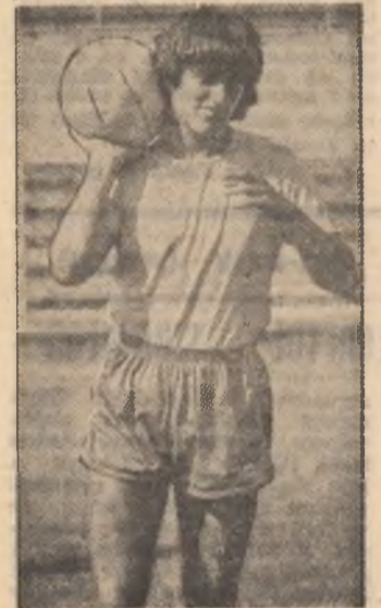
Futre, una din „cheile” neașteptate (dar meritabile) victorii a portughezilor în ultimul act al C.C.E.

Belgianul Alexis Ponnet a condus formațiile: PORTO: Mlynarczyk — Pinto, Celso, Luis, Ignacio (min. 65 Frasco), André, Magalhães, Azevedo (min. 46 Juary), Madjer, Sousa, Futre. BAYERN: Pfaff — Winklhofer, Nachtweil, Eder, Pfügler, Flick (min. 81 Lunde), Brehme, Matthäus, M. Rummenigge, D. Höness, Kôgl.