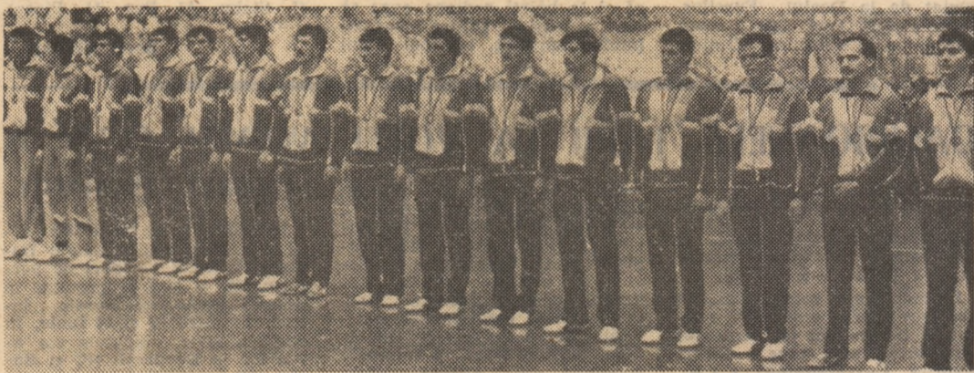
Lotul selecționatei României, campioană mondială universitară