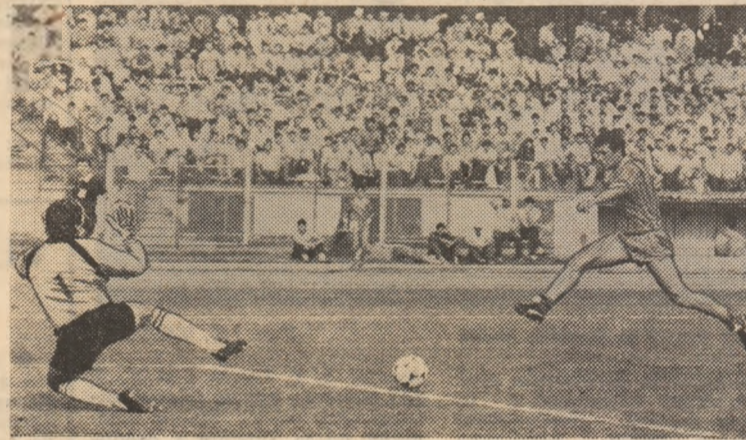
Cămătaru înscrie golul nr. 32 al său, gol înregistrat în partida Dinamo — Flacăra Moreni

● Tinerii jucători ai Gloriei Teodorescu și Timis, încă juniori, au evoluat (după pauză) excelent, neastîmpărul și inspirația lor arîmînd o forma-ție ce parcă pierduse busola și... meciul! Ambii au aniversat astfel, Teodorescu chiar printr-un gol superb, terminarea lileului, ultima zi de școală fiind ziua întîlnirii cu Sportul Studențesc.