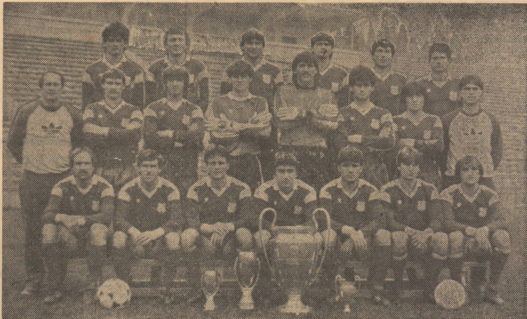
Cîștigătoare a Cupei Campionilor Europeni în ediția 1985-86 și a „Supercupei” Europei, STEAUA a cucerit din nou și titlul de campioană a României. Iată, în imagine, lotul campionilor țării.

● Dinamo și Victoria — pe celelalte locuri ale podiumului ● Jiul, Gloria și Chimia — pe ultimele poziții ale clasamentului ● Luni, la București, partida de încheiere a campionatului: Steaua — Universitatea Craiova