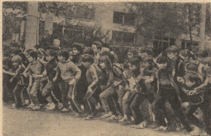
Vacanța de vară, care începe astăzi — pentru șoimii patriei și purtătorii cravatei roșii cu tricolor — constituie un binevenit prilej de desfășurare a unor activități sportive în aer liber.

Pregătirea multilaterală pentru muncă și viață a șoimilor patriei, scolarilor și pionierilor presupune dezvoltarea armonioasă, fizică și intelectuală, a acestora. Iar educația fizică și sportul, turismul și celelalte activități aplicative de profil, componente ale sistemului general al muncii educative pionieresti, contribuie la călirea fizică și morală a copiilor, la creșterea