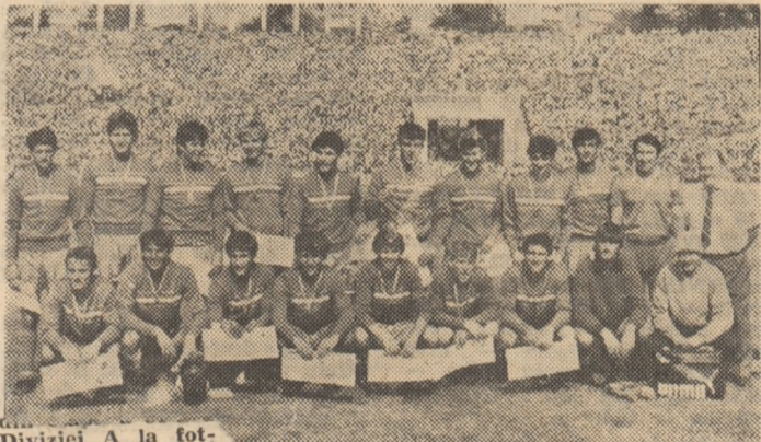
Divizia A la fotbal. Echipa de juniori Dinamo București, câștigătoare a finalei Campionatului Republican.