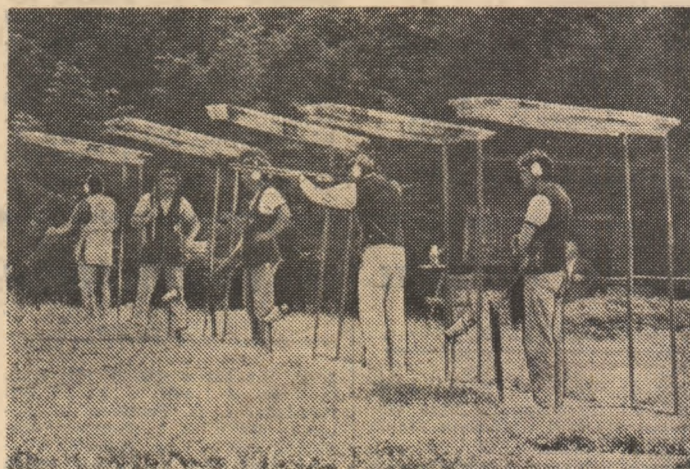
Aspect din proba de talere din cadrul Marelui Premiu „Carpați”, ediția a 18-a, poligonul Tunari