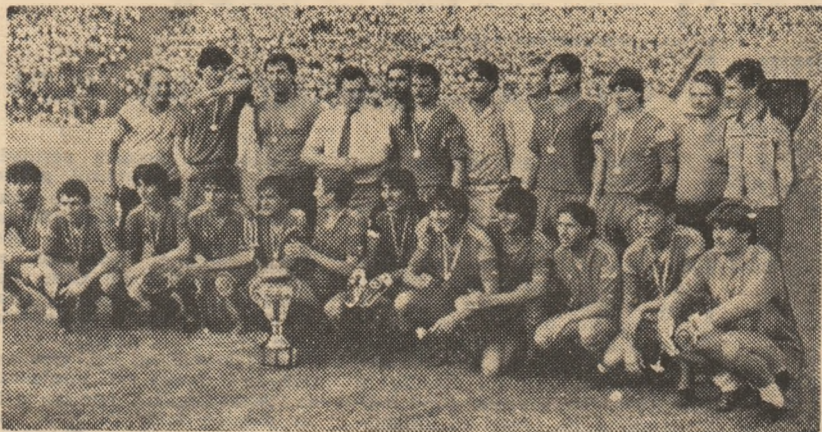
Invingătorii de ieri, steliștii, cu noul lor trofeu, „Cupa României”

Roș-albaștrii cuceresc pentru a 15-a oară trofeul!