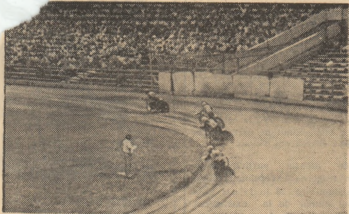
În concursul individual de duminică, talentatul nostru motociclist Marius Șoaită, ieșit din ultimul viraj, a terminat victorios în 3 din cele 5 manșe în care a evoluat.